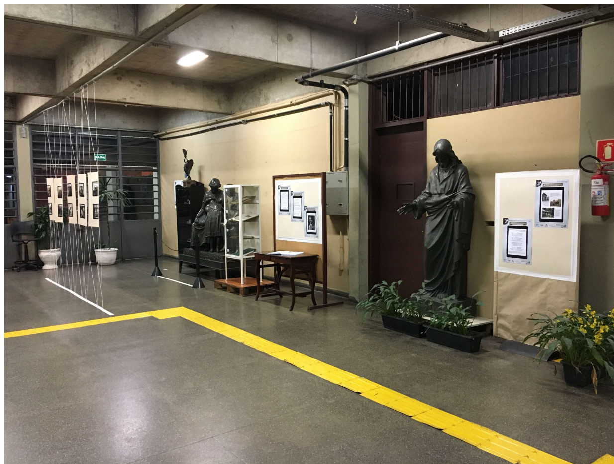
Vista Geral da Exposição.