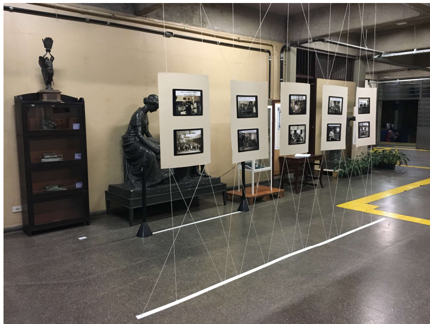
Vista geral e detalhe de painel com fotografias.