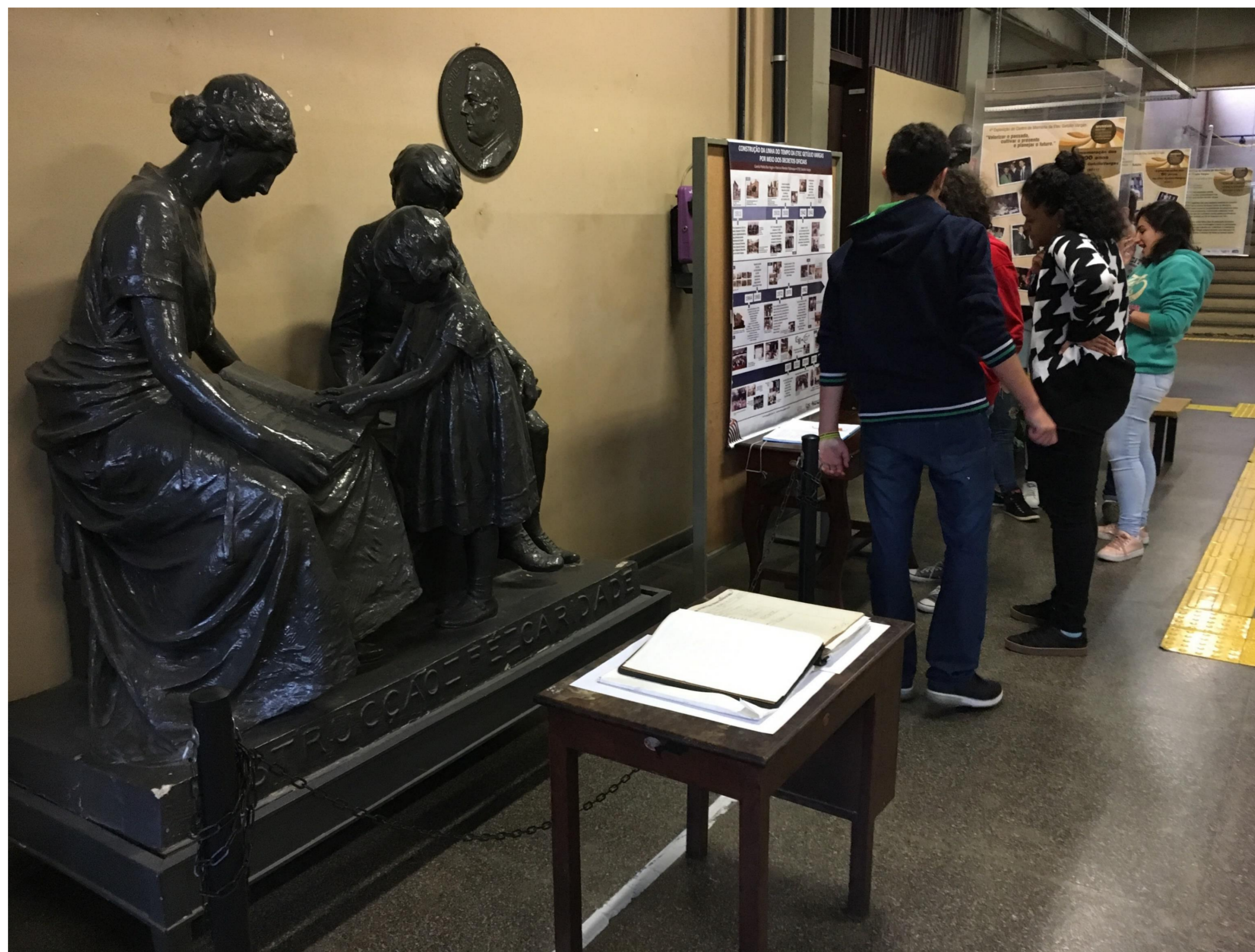
Vista geral da exposição.