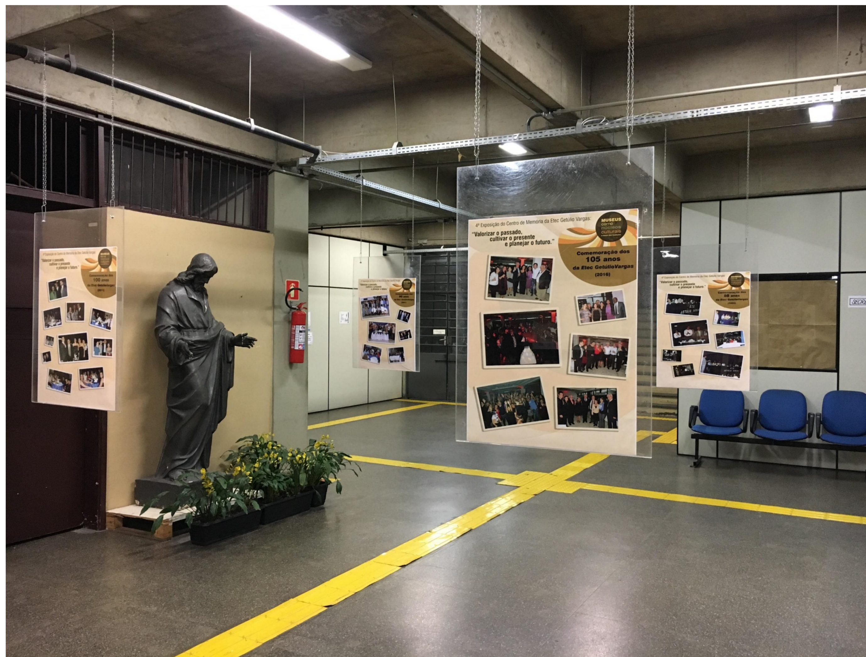
Vista geral da exposição. Destaque para os painéis montados com fotografias de alguns aniversários da Etec Getúlio Vargas.